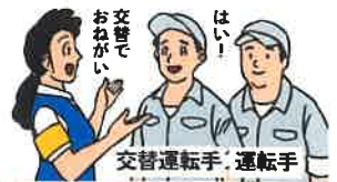
交替運転手の配置