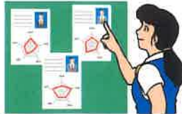
運転者の適性等の把握