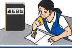
運転日誌の備付け