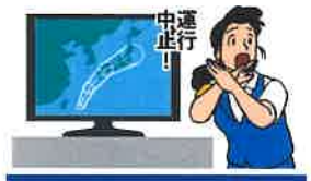
異常気象時等の措置